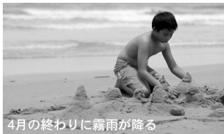
4月の終わりに霧雨が降る