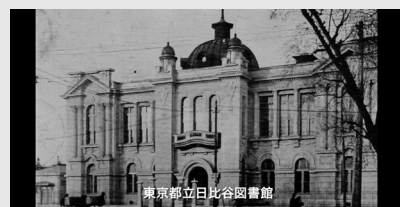
東京都立日比谷図書館

© 2013 cinemabox.bunkaikankai. all rights reserved