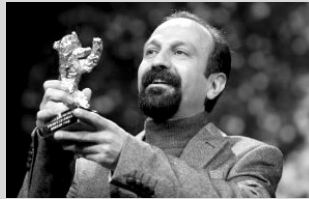
アスガー・ファルハディ監督

※定員制。各回入替制。 ※チケットはすべて当日券。前売り券はありません。 ※障がい者の方は無料。福岡市在住の65歳以上の方は 250円。(手帳の提示が必要です) ※「わの会」会員は250円。(会員証の提示が必要です)