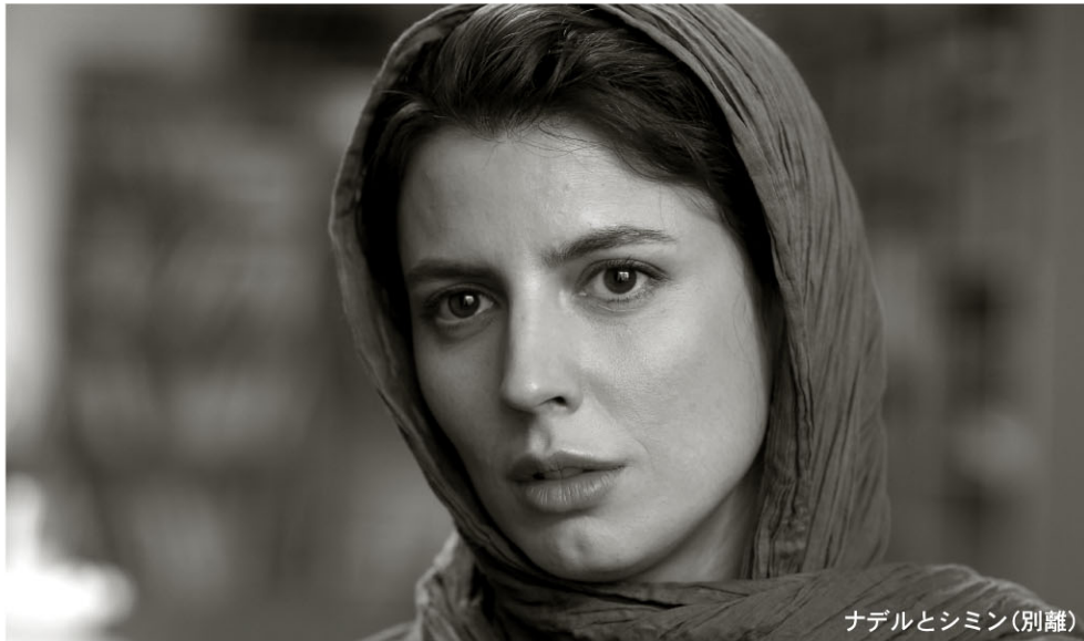
ナデルとシミン(別離)