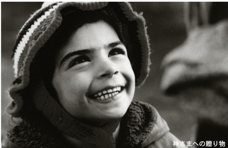
神さまへの贈り物