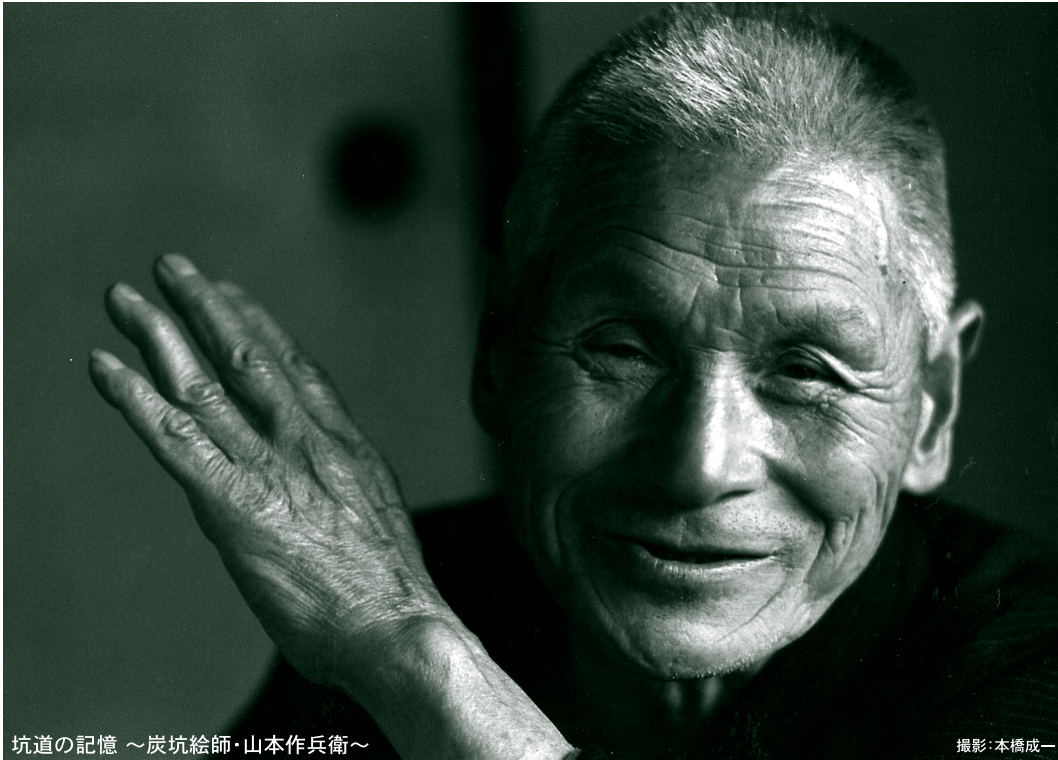
坑道の記憶 ～炭坑絵師・山本作兵衛～