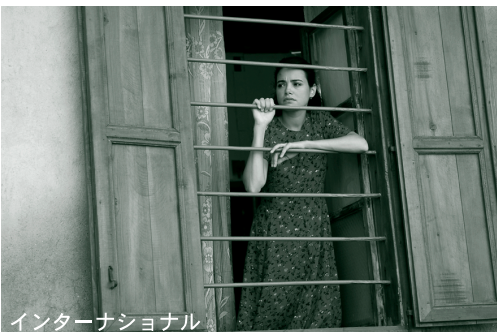
インターナショナル