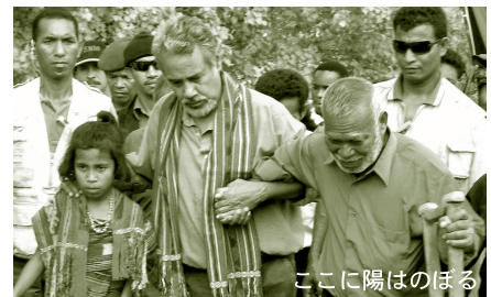
ここに陽はのぼる