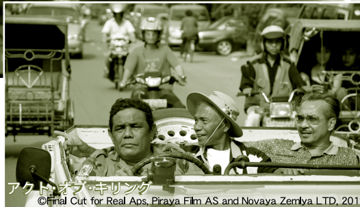
アクト・オブ・キリング