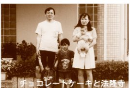
チョコレートケーキと法隆寺