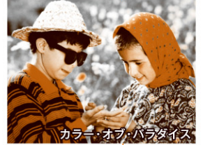
カラー・オブ・パラダイス