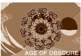
AGE OF OBSCURE