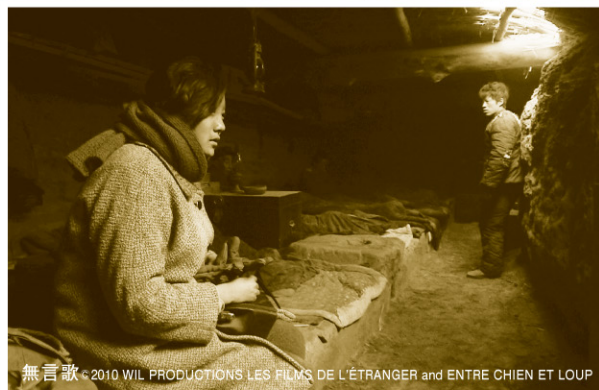
無言歌 ~2010 WIL PRODUCTIONS LES FILMS DE L'ÉTRANGER and ENTRE CHIEN ET LOUP