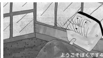
ようこそほくです4