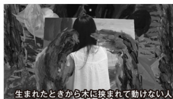
生まれたときから木に挟まれて動けない人