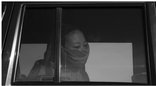
ティマー・クンデンを探して

※前売り券はチケットぴあ(Pコード467-212)、 ローソンチケット(Lコード81466)で販売。 ※定員制。各回入替制。 ※障がい者、高齢者及び「わの会」割引なし。 ※4回券、フリーパス券はお一人様用です。 複数人での使用はできません。