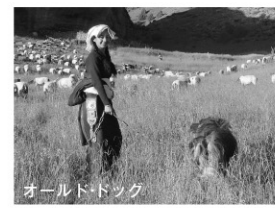
オールド・ドッグ

作品賞に選ばれている。今回上映するペマ・ツェテン監督の3作品はすべて福岡初公開となる。現在注目の監督である。