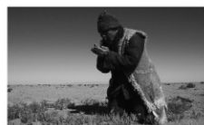
©2010 WIL PRODUCTIONS LES FILMS DE L'ÉTRANGER and ENTRE CHIEN ET LOUP

監督:ワン・ビン 出演:ルウ・イエ リャン・レンジュン 2010年/デジタル/カラー/ 109分/香港=フランス=ベルギー 日本語字幕付き