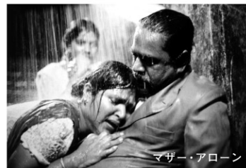
マザー・アローン