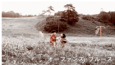
オーファンス・ブルース