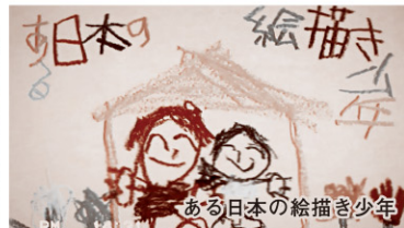
ある日本の絵描き少年