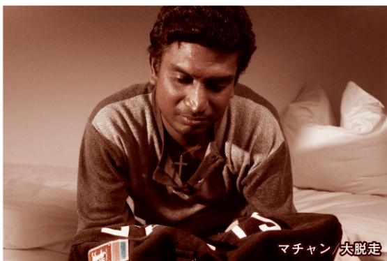
マチャン / 大脱走