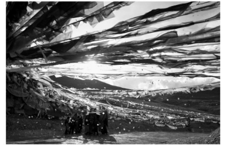
監督:チャン・ヤン 出演:ヤンペル ニマ 2015年/デジタル/カラー/115分/中国/日本語字幕付き