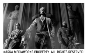
監督:SS.ラージャマウリ 出演:ブラバース ラーナー・ダッグバーティ 2017年/デジタル/カラー/167分 インド/日本語字幕付き

物語はマヒシュマティ王国の王位継承争いから始まる。主人公マヘンドラ・バーバリの父親であるアレマンドラ・バーバリは、デーヴァセーナを妃とする代わりにバララデーヴァに王位を奪われ、殺害される。真実を知ったマヘンドラ・バーバリはバララデーヴァに挑んでいく。「バーバリ2部作」の後編。本作はインド最高の製作費と3年の歳月を費やして完成。インド映画らしい歌と踊り、驚くべきアクションとVFXが全世界を魅了した。