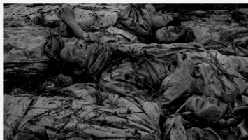
土の人 2017 劇場版