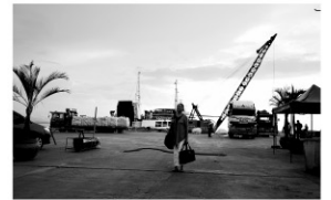
監督:ラヴ・ディアス 出演:チャロ・サントス・コンシオ ジョン・ロイド・クルス 2016年/デジタル/モノクロ/228分 フィリピン/日本語字幕付き

1997年のフィリピン。殺人の罪で30年間を刑務所で過ごしたホラシアは、実は親友が真犯人であり、その黒幕はかつての恋人ロドリゴであることを知る。釈放されたホラシアはロドリゴに復讐するため彼の身辺を探っていく。トルストイの短編小説に着想を得た壮絶な復讐の物語。モノクロとロングショットの長回しを基調とした4時間弱の長編で、フィリピン映画界を代表するラヴ・ディアス監督の日本で初めての劇場公開作品。2016年ベネチア映画祭金獅子賞受賞。