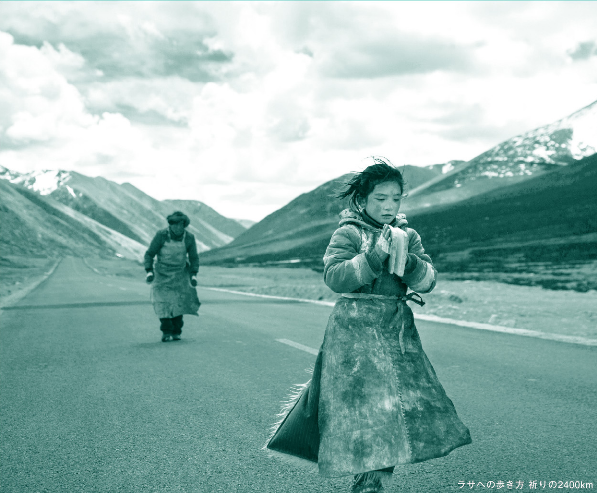
ラサへの歩き方 祈りの2400km