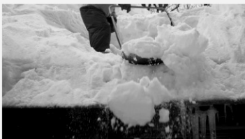
With Friction, As Friction