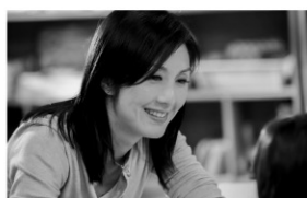
©2015 Universe Entertainment Limited All Rights Reserved 監督:エイドリアン・クワン 出演:ミリアム・ヨン ルイス・クー 2015年/デジタル/カラー/112分 香港=中国/日本語字幕付き

有名幼稚園の園長ルイは仕事に疲れて退職する。ところがある日ルイは、園長がおらず閉園の危機にある幼稚園のニュースを見て、園に残った5人の子どもを助けるため園長になる決意をする。貧しい家庭、移民の子どもなど様々な子どもたちのためにルイは奔走する。2009年香港で実際に起きた出来事を映画化した作品。その年の興行収入第一位を獲得し、2016年香港金像獎で作品賞など5部門にノミネートされた。アジアフォーカス・福岡国際映画祭で観客賞を獲得した感動作。