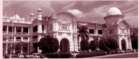
イポーのシンボリック的存在であるイポー駅舎

『ジミ・アスマラ』の撮影舞台で、『水辺の物語』のウー・ミンジン監督の出身地であるイポー市は、福岡市の姉妹都市です。