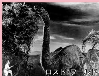
ロスト・ワールド