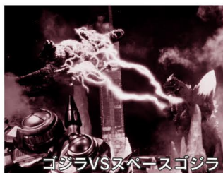
ゴジラVSスペースゴジラ