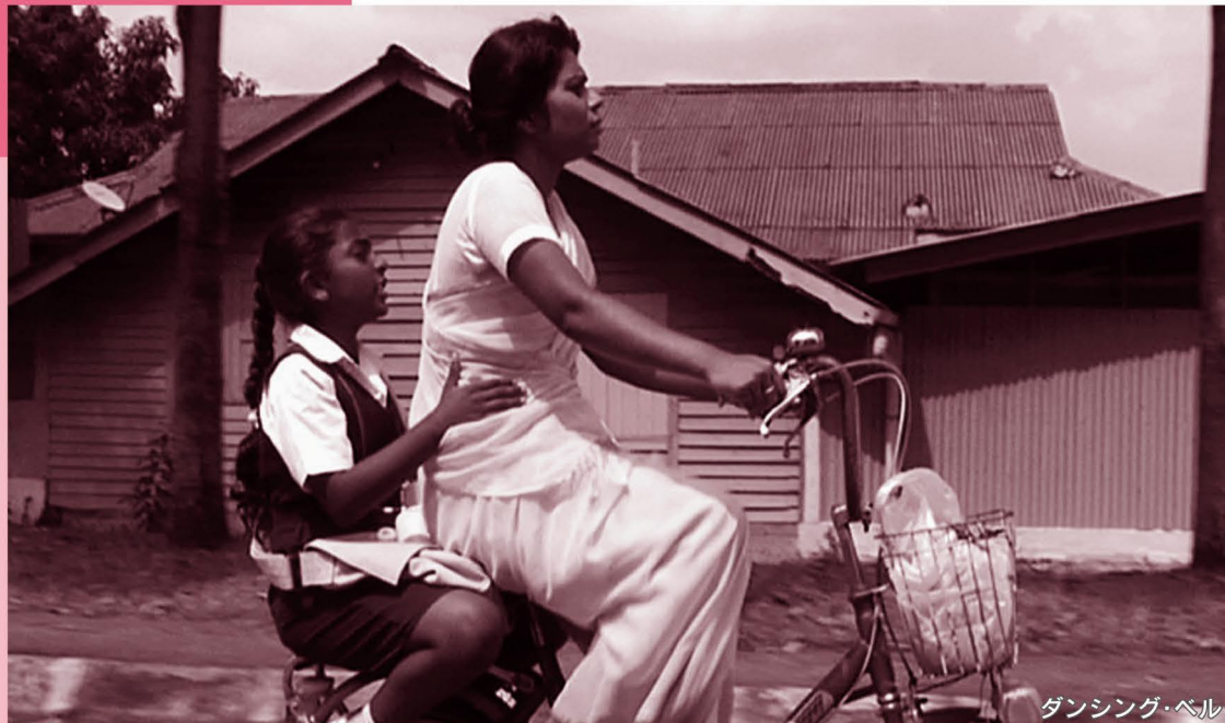
ダンシング・ベル