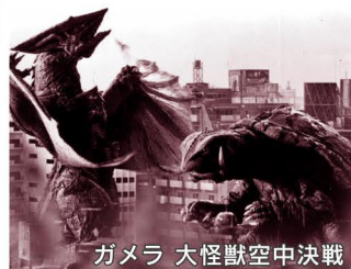
ガメラ 大怪獣空中決戦