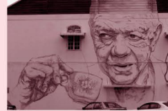
旧市街のウォールアート

福岡市とイポー市は1989年(平成元年)に姉妹都市締結し、これまでも青少年交流や文化芸術交流など幅広い分野で交流を深めています。