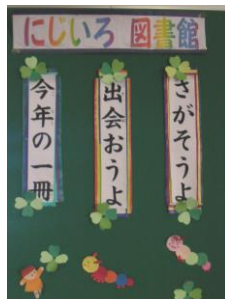
・ 入口右側の掲示

「にじいろ図書館」という素敵な名前は、夢のある図書館にしたいという願いを込めて、当時、教頭として勤務されていた現在の校長先生が、当時の図書ボランティアさんたちと名づけられました。