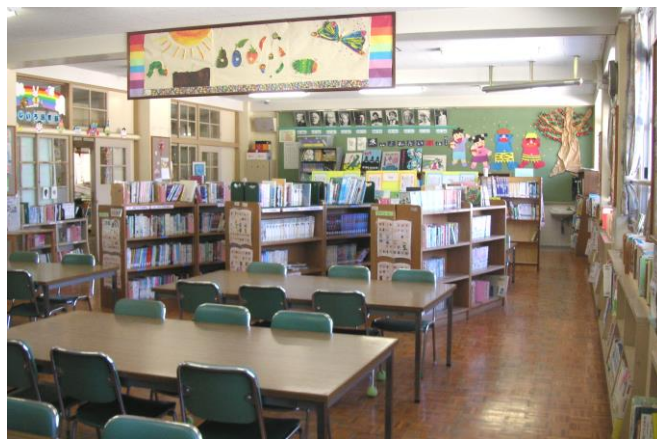
・ 背面から正面カウンター側を臨む

取材に伺ったのは2月初旬でした。正面掲示板（写真右）には節分の様子がみごとに掲示されていました。図書ボランティアさんの作です。