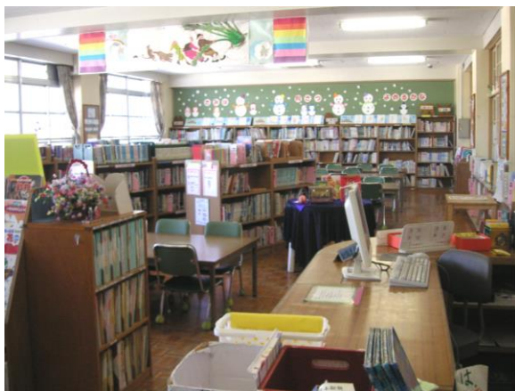
・ カウンターから背面側を臨む