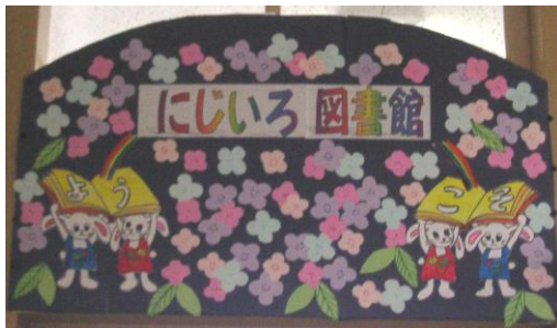
・ 入口上にある図書館名の掲示