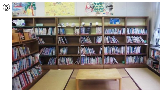
(写真⑤: 絵本のコーナー)