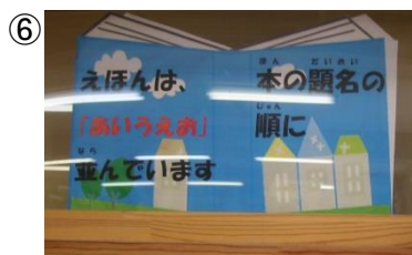
(写真⑥・⑦: 絵本コーナーの表示)