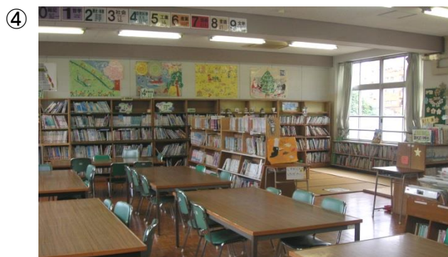
(写真④: 後方から入口側を臨む)