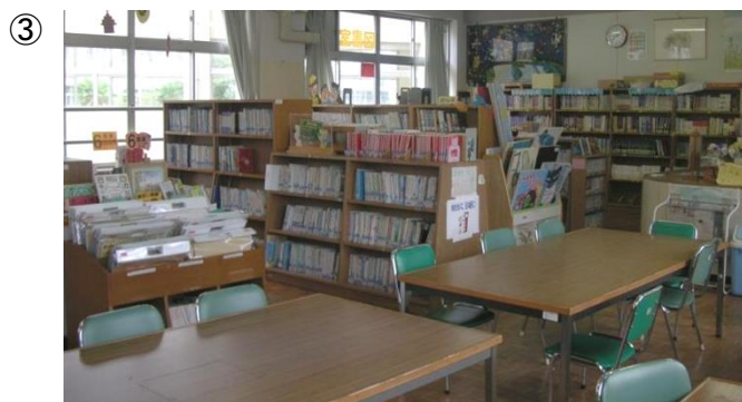
(写真③: 入口前方から後方を臨む)

内浜小学校学校図書館は市内の多くの学校に見られる設計・規模のものですが、レイアウトを工夫し、狭さをさほど感じさせることなく、使い勝手のよいものになっています。