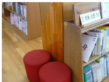
書架の横のちょっとしたスペースに、赤い丸イスが置いてあり、リラックス感を生み出しています。(写真左上)