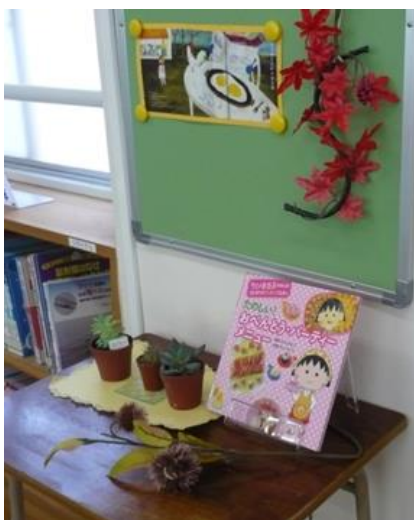
生徒用机を活用して本のミニ紹介コーナーが作られています。