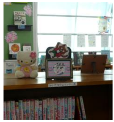
上記の偉人たちの紹介レポートは、関連本が設置してある書棚のあちこちにも置かれています。さらに、窓のバーには、先生たち全員によるおすすめ本の紹介文が貼ってあります。(写真右)