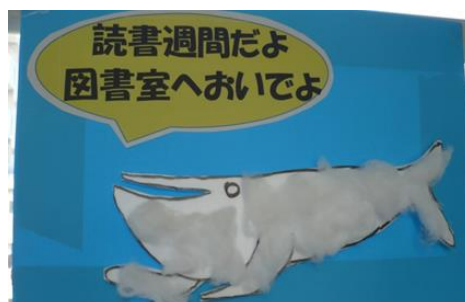
図書館に続く廊下には、「くじらぐも図書館」の名前にふさわしく、くじらぐもが、子どもたちを学校図書館へと誘っています。(写真左下)