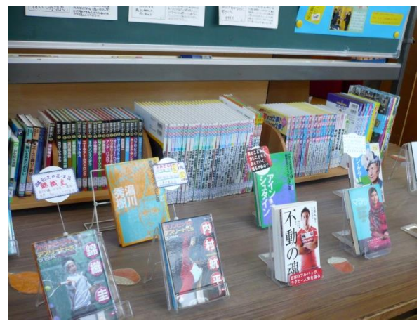
「立志応援文庫」のコーナーでは、緑板を活用して子どもたちが学習活動で調べた偉人たちについての紹介レポートが掲示してありました。(写真左) *天井の魚の飾りにもご注目を！