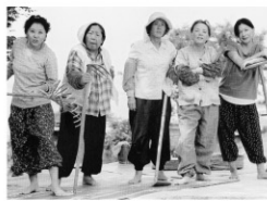
監督:チュ・チャンミン 出演:イ・ジョンジン イ・ムンシク