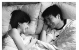
監督:ミン・ギョドン 出演:オム・ジョンファ ファン・ジョンミン