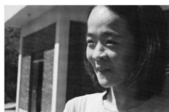
監督:ハム・ギョノク 出演:バク・ジウォン シン・ヨンスク ※15才未満の方は鑑賞できません。

4/22 (日) 11:00 | 27 (金) 17:00 | 30 (月・祝) 14:00