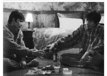
監督:キム・ドンヒョン 出演:バク・インス チェ・ヒジン