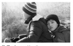
監督:チャン・リュル 出演:ツイ・ジェン イン・ラン

2010年/35ミリ/カラー/92分/韓国=中国=フランス/日本語・英語字幕付き