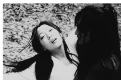
監督:キム・ヨンジュン 出演:シン・ヒョンジュン キム・ヒソン

4/18 (水) 14:00 | 26 (木) 17:00 | 28 (土) 14:00