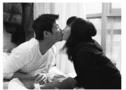
監督:チャン・ゴンジェ 出演:ソ・ジュンヨン イ・ミンジ