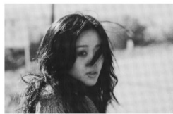
監督:チン・スンヒョン 出演:バク・ウンス ソン・ハリム ※15才未満の方は鑑賞できません。