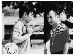
監督:イ・ミニョン 出演:チャ・インピョ チャン・ミヒ