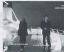
監督 ジャン=リュック・ゴダール 出演 マチアス・ドマイディ ナデージュ・ボゾン=ディアニョ

地中海を周遊する豪華客船ゴールデン・ウェブ号に搭乗した様々な人々、フランスの田舎でガソリンスタンド経営する一家、エジプト、パレスチナなど人類の歴史的な出来事が起きた場所。本作は3部構成の作品で、ゴダールらしい映像美と音響で構成された映像詩。