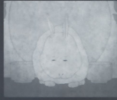
グレートラビット