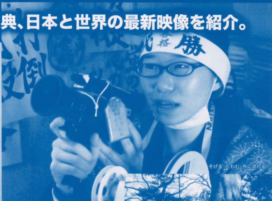
そげる・たわむ・外に流れる