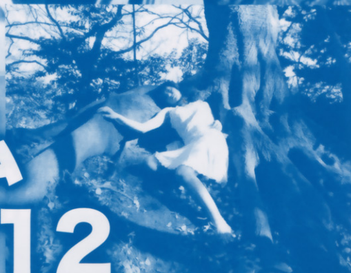
MOONS (Part 1)

欧州連合 (EU) 加盟国の選りすぐりの映画により、ヨーロッパ社会・文化の多様性を紹介。