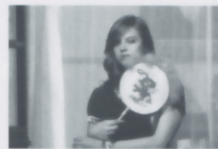
監督 マノエル・デ・オリヴェイラ 出演 リカルド・トレバ カタリナ・ヴァレンシュタイン

会計士マカリオは、職場の向かいの家に住むブロンドのルイザに恋をする。結婚をしようとするマカリオだが、叔父に反対され職を失ってしまう。オリヴェイラ監督100歳の時の作品だが、全編に若々しさを感じる奇跡のような作品。