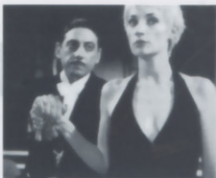
監督 ジャック・リヴェット 出演 ジャンヌ・パリバル セルジオ・カステリット

イタリアの劇団の女優カミーユは、パリに公演にやってくる。しかしパリにはかつての恋人ピエールがいた。一方劇団の座長ウーゴは17世紀に書かれた幻の戯曲を探す。ユーモアとサスペンスに溢れた巨匠ジャック・リヴェットの傑作。