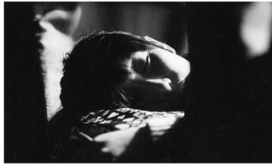
2011年/35ミリ/カラー/88分/中国=台湾/日本語・英語字幕付き 監督:トン・ヨンシン 出演:チン・ハイルー タン・チュン

ツァオ・リーは上海で家政婦をする同郷のシエ・チンの元にやって来る。リーは同じく同郷のゴウの紹介でカラオケ店で働くが、ゴウは正月の帰省ラッシュを見込んで、ポンコツのバスを無断で修理して、帰省ツアーのチケットを売ることを考える。経済成長著しい上海に出稼ぎにやってくる人々を描いた作品。高層ビルの下でひしめく様に暮らす人々を愛情込めて描いている。