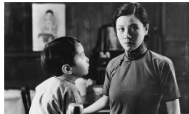
1934年/35ミリ/モノクロ/サイレント/82分/中国/日本語字幕付き 監督:ウー・ヨンカン 出演:ロアン・リンユイ リー・チェン

母親は小さな子供を抱えて娼婦をして暮らしていた。ヤクザな男に虐げられる母親だが、子供の成長だけが彼女の希望だった。ある日母親は金を盗んだ男を殺してしまう。母親は懲役刑を受け、学校の校長が子供を引き取るのだった。34年下半年期における中国映画最大の収穫と高く評価された作品。悲劇の女性を演じる伝説の女優、ロアン・リンユイの演技が素晴らしい。 ※本作は音のないサイレント映画です。