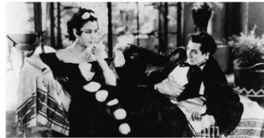
1937年/35ミリ/モノクロ/108分/中国/日本語字幕付き 監督:シェン・シーリン 出演:チャオ・タン パイ・ヤン

病弱な小徐は大学を卒業したが職がなく、自殺を考える。それを知った友人たちは小徐を助け、4人で暮らすことになる。ある日友人の一人ラオチャオは町で見かけた女性・楊に一目ぼれする。不景気による自殺や失業などの社会問題が、イタリアのネオリアリズムのように描かれているが、映画のテンポは喜劇的であり、アメリカ映画に影響されたとされる軽快なギャグがちりばめられている。戦前の小津安二郎監督作品を思わせる映画。