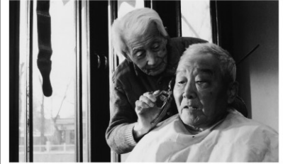
2006年/35ミリ/カラー/104分/中国/日本語・英語字幕付き 監督:ハスチョロー 出演:チン・クイ チャン・ヤオシン

北京の古い街に住むチンは93歳で、80年以上もこの街で理容師として働いていた。街には馴染み客が多かったが、少しずつ知り合いが減っていた。ある日役所の人に来て、近々街が取り壊されると告げていく。年老いた理髪師の日常を丹念に描いた作品。発展する北京の裏通りで、一人穏やかに暮らす老人の姿は静かな感動を呼ぶ。