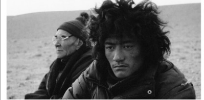
2010年/ビデオ/カラー/89分/中国/日本語・英語字幕付き 監督:ソントタルジャ 出演:イシ・ルンドゥップ ルジェ

チベット高原。ニマは結婚式を控えたある日、母親を誤って耕運機で轢き殺してしまう。ニマは贖罪のため、ラサまで五体投地の旅に出る。ラサからの帰路、一人砂漠を歩くニマに老人が声をかけバスに乗るように促すが、ニマは無視して歩く。やむなく老人はニマと一緒に歩き始める。命を懸けた贖罪の旅の中で、老人との会話などをとおしてニマは次第に自分を取り戻していく。どこまでも広がる広大な大地と高地の強い日差しが印象的。