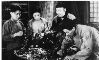
1933年/35ミリ/モノクロ/サウンド版/102分/中国/日本語字幕付き 監督:ジョン・ブーカオ 出演:シアオ・イン コン・チアノン