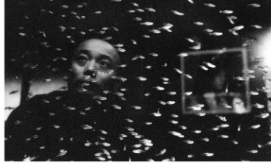
2004年/35ミリ/カラー/89分/中国/日本語・英語字幕付き 監督:チャン・ピンジェン 出演:グオ・ヨウ チン・ハイルー

カメラマンのシェンは浮気をしていて、ある日妻に気付かれてしまい、口論の結果シェンは妻を殺してしまう。山に妻の死体を埋めるシェン。ところが死体が発見され、精神的に不安定になるシェンに妻の幽霊が見えるようになる。中国映画初の本格的サイコホラー映画と言われる作品。監督は現代美術の作家でもあり、幻覚とも現実ともつかない不思議な映像世界を見ることができる。