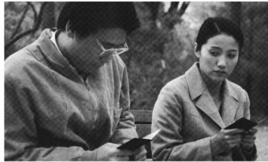
2007年/35ミリ/カラー/114分/中国/日本語・英語字幕付き 監督:チュアン・ユイシン 出演:イエン・ピンイエン チー・チア

1977年の北京。中学生のチェンは不良少女のリーダーだが、ある日からかった男子からレングで殴られる。大学生となったチェンは妻子ある男と不倫関係を持つ。密かに墮胎したことがばれた彼女は大学を中退する。その後チェンは結婚するが、夫を愛することができないのだった。77年から10年間の、一人の女性の3人の男性との愛を描いた作品。常に痛みを伴った愛情表現が描かれる作品。