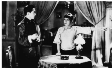
1937年/35ミリ/モノクロ/123分/中国/日本語字幕付き 監督:マーシェイ・ウェイパン 出演:フー・ピン チン・シャン

ある村の古い劇場に、劇団がやって来て公演を行う。主演の孫は上手く歌えずに苦労するが、夜一人で練習するとどこからか歌声が聞こえ、孫はその歌声に助けられ公演は成功する。声の主を探す孫は屋根裏で黒マントの男と出会う。アメリカ映画「オペラ座の怪人」の中国版。封建的な社会に反抗する若者の悲劇に、中国の怪奇伝承がうまく取り入れられており、映画は大ヒットした。