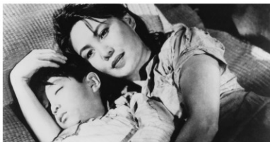
1947年/35ミリ/モノクロ/195分/中国/日本語字幕付き 監督:ツイ・チュウション チョン・チュンリー 出演:タオ・チン パイ・ヤン

1931年から45年までの日中戦争時代を背景にした作品。上海で働く女性素芬は、学校の先生をしていた張と知り合い結婚する。子供も生まれるが戦争のため張は抗日戦に参加し、素芬は上海で夫の帰りを待つ。しかし張は国民党の中で次第に墮落していく。国共内戦の最中に製作された、国民党の腐敗を告発した内容の作品で、大ヒットした戦争叙事詩。当時の中国映画を代表する1本。 ※途中5分間の休憩あり。