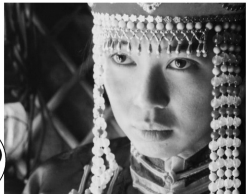
2006年/35ミリ/カラー/95分/中国/日本語・英語字幕付き 監督:ワン・チュアンアン 出演:ユー・ナン バトル