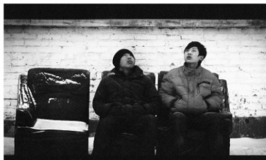
2010年/ビデオ/カラー/91分/中国/日本語・英語字幕付き 監督:リー・ホンチー 出演:パイ・ジュンジェ ジャン・ナーチー

中国、内モンゴルの田舎町。暇を持て余す高校生の5人組が、日々ぶらぶらと過ごす様子を描いた作品。また同じアパートに住む幼児ジョンシンの家族の退屈な日常も描かれる。カウリスマキ監督を思わせる、間をはずすようなとぼけた笑いを引き起こす作品だが、世界中の若者の共感を呼ぶ。ロカルノ映画祭金豹賞受賞。