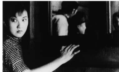
1937年/35ミリ/モノクロ/95分/中国/日本語字幕付き 監督:ユアン・ムーチー 出演:チャオ・タン チョウ・シュアン

小紅は騙されて上海につれてこれ、茶館や居酒屋で芸をさせられる。小紅の家の近くにラッパを吹く陳が住んでおり、二人は次第に親密になっていく。ある日ヤクザの成龍が小紅を気に入る、自分のものにしようとする。小紅と陳は友人の助けを借り、二人で街を逃げ出す。1930年代の上海に暮らす貧しい人々の様子を生き生きと描いた作品。アメリカ映画「第七天国」を下敷きにしたと思われる、明るい雰囲気の特徴。