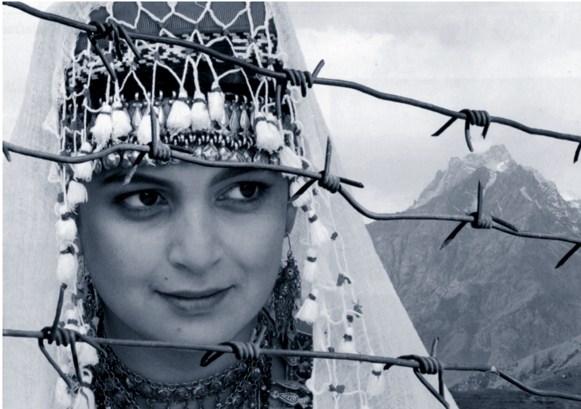
トゥルー・ヌーン