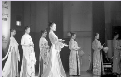
福岡で開催した「ベトナムフェスティバル」の様子(2012年)