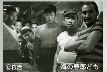
日活 海の野郎ども