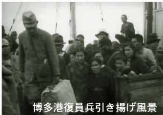
博多港復員兵引き揚げ風景