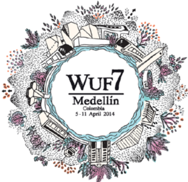
「第7回世界都市フォーラム」のロゴ・マーク