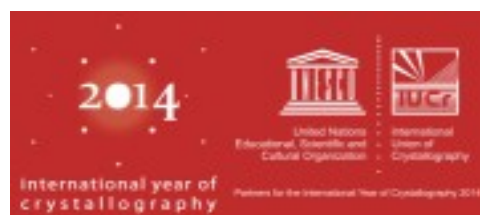
「世界結晶年2014」の公式ロゴ・マーク

世の中の物質の性質を理解する上で、結晶学は基本となる学問です。医薬品、農業、新素材開発、練り歯磨きから航空機まで新しい物質の開発にはバイオテクノロジーやナノテクノロジー等結晶学の知識が基礎にあり、私たちの生活を支えています。