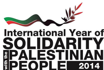
「パレスチナ人民連帯の国際年」のロゴマーク

67年前の1947年11月29日、国連総会はイスラエルとパレスチナの二国間共存というビジョンを打ち出し、その後1977年に11月29日を「パレスチナ人民連帯国際デー」と決めました。そのビジョンを達成するために、国連は専門機関やプログラムを通じて各種の支援を続けています。