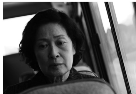
©2009 CJ ENTERTAINMENT INC. & BARUNSON CO., LTD. ALL RIGHTS RESERVED