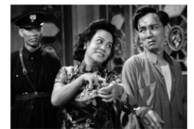
ショウ・ブラザーズ

上海で作られた舞台喜劇を、中国=香港合作で映画化した群衆喜劇の傑作。舞台は1940年代の廣州に移しかえられ、広東語の活気に満ちた掛け合いとアパートのセットを巧みに生かした演出が光る。1973年には香港で劬氏兄弟によるリメイクが大ヒットし、『カンフーハッスル』(2002、周星馳)でも参照されるなど、後年の香港映画に与えた影響も大きい。