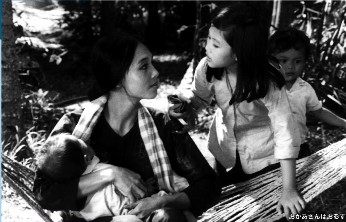
おかあさんはおるす