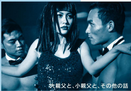
大親父と、小親父と、その他の話