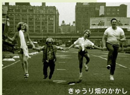
きゅうり畑のかかし