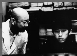
1988年/35ミリ/カラー/109分 活人堂シネマ=都市環境開発 監督:松本俊夫 出演:桂枝雀 松田洋二

九州医科大学の精神科の病室で記憶を失った少年が目覚める。彼の担当医である若林教授は、少年が恐ろしいショックのため記憶を失った事を語り、記憶を呼び戻す手助けをする。福岡出身の作家・夢野久作の同名小説を映画化したもの。複雑な構成で映像化不可能と言われた原作を、現実とも妄想ともつかない映像で描き、見る者をメビウスの輪のような特異な世界に誘う作品。