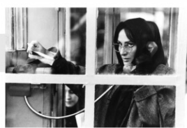
1988年/35ミリ/カラー/160分 イラン/日本語・英語字幕付き 監督:ババラム・ベイザイ 出演:ダリウシュ・ファルハンク スサン・タスリミ

テレビ番組を製作しているモダベルは、ある日知らない男の車に乗っている妻を見つめる。妻の不倫を疑うモダベルは、相手の男が骨董屋であることを突き止める。インタビューと偽って店に入るモダベルは意外な事実を知ることになる。現代社会の不安やアイデンティティーの喪失をテーマとした作品で、イラン映画の巨匠ベイザイ監督が独特の映像美で魅せる。