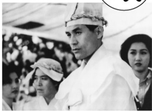
1996年/35ミリ/カラー/100分/韓国 日本語・英語字幕付き 監督:イム・グォンテク 出演:アン・ソンギ オ・ジョンヘ

韓国映画の巨匠イム・グォンテク監督が韓国の伝統的な葬式を舞台に、様々な人間模様を描いた作品。監督は伝統的な風習を民俗学のように細かく描きながら、人間関係の煩わしさや醜さと同様に、人間の温もりや優しさを込めていく。またジュンソプが娘のために書いた童話には生と死を見つめる監督の思いが込められている。すべてを受け入れながら微笑むジュンソプを、名優アン・ソンギが好演する傑作である。