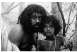
2004年/35ミリ/カラー/117分 スリランカ/日本語・英語字幕付き 監督:ソーマラトゥネ・ディサーナーヤカ 出演:ジャクソン・アントニー ジャヤラトゥ・マノラトゥネ

19世紀、スリランカの村。セーディリスは山で禁じられている罫を密かに行っていた。ある日その山に僧侶が住み着き、殺生をしてはいけないとセーディリスを諭す。セーディリスは何とか僧侶を山から追い出そうとするのだが、ことごとく失敗してしまう。不思議な力を持つ僧侶と罫師との戦いをコミカルに描き、スリランカで大ヒットした作品。