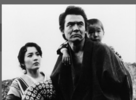
1981年/35ミリ/カラー/140分/東映 監督:蔵原性緒 深作欣二 出演:佐藤浩市 松坂慶子

筑豊に生まれた伊吹信介の父親・重蔵はみんなに慕われる炭鉱夫だったが、落盤事故で死んでしまう。以来信介と母親のタエの面倒を見るのはヤクザの竜五郎だった。やがて母親のタエは結核に冒されてしまう。五木寛之の自伝的大河小説「青春の門 筑豊編」の映画化。実際に筑豊で撮影されており、主人公伊吹信介の幼年期から青年期が、大正・昭和史と重ねて描かれる。