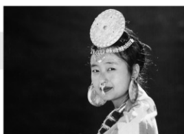
2002年/35ミリ/カラー/113分 ネパール/日本語・英語字幕付き 監督:ナビン・スッパ 出演:アヌバナ・スッパ アロック・ネムパン

ネパールの少数民族リンブー族。少女ヌマブんにオジャハンという青年が結婚を申し込む。二人は結婚するがオジャハンが急死、ヌマブンは流産してしまう。家に帰されたヌマブンの元にギリハンという粗暴な男が求婚してくる。広大なヒマラヤの山々を背景に、古い習慣に縛られた家族の悲劇を描いた物語。