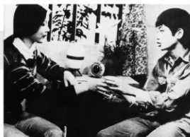
1987年/35ミリ/モノクロ/74分 ベトナム/日本語・英語字幕付き 監督:ドゥーミン・トゥアン 出演:トゥアン・ズン トゥー・チャン

ドイモイ政策(経済開放政策)以降のベトナム。両親の離婚、兄は犯罪者になり、主人公の15歳の少年は自活しながら学校に通う。新しい社会の中で崩壊していく一家と、その中で純粋な心を失わない少年を描いた作品。少年の孤独な心情が詩的な映像で描かれ、新世代のベトナム映画と評価された。