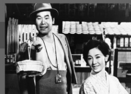
1969年/35ミリ/カラー/91分/松竹 監督:山田洋次 出演:渥美清 倍賞千恵子

車寅次郎はみんなに「フーテンの寅」と呼ばれる香具師。中学の時に家出した寅次郎がふらりと故郷の柴又に帰ってくる。たった一人の妹・さくらのために奮闘する寅次郎は、縁談の席で慣れない作法で大失敗をしてしまう。そしてさくらに工場の職人・博が求婚する。人が良くて惚れっぽい寅次郎が引き起こすドタバタを描いた喜劇映画の傑作。20年以上も続いた日本映画を代表する人気シリーズの第一作。