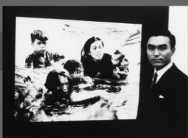
1996年/16ミリ/カラー ドキュメンタリー/114分 グループ現代-みちのく銀行 監督:五十嵐匠

ベトナム戦争を撮影した写真「安全への逃避」(66年)でピューリッツァー賞を受賞した、カメラマン・沢田教一の生涯に迫ったドキュメンタリー映画。青森に生まれた沢田は写真店に勤め、61年に上京しUPJ東京支局に入社する。65年からベトナム戦争取材し、数多くの写真を撮る。70年カンボジア取材中に銃撃戦に巻き込まれて死亡する。同僚や先輩の証言などを含め、沢田の生き様を鮮烈に浮かび上がらせている。