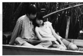
2009年/35ミリ/カラー/100分 マレーシア/日本語・英語字幕付き 監督:ウー・ミンジン 出演:チュン・シュンユアン フー・フェイリン

近くに大きな川が流れるマレーシアの田舎の村に暮らす、中国系の漁師の父と息子の物語。父親は近くに昔の恋人が住んでおり、彼女と結婚しなかったことを悔やんでいた。息子もリリという女性が好きなのだが、リリは金持の男性以外とは結婚しないと言うのだった。父と息子が時間を隔てて同じ悩みにぶつかる状況を、静かな映像で描いた作品。