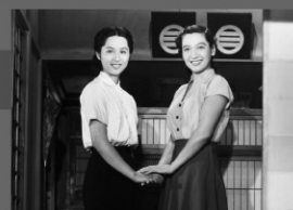
1953年/35ミリ/モノクロ/136分/松竹 監督:小津安二郎 出演:笠智衆 原節子

尾道に暮らす老夫婦が東京で生活する子供達を尋ねてやって来る。しかし長男も長女も忙しく、ゆっくりと二人の相手をする事ができない。親身に世話を焼くのは戦死した次男の妻の紀子だった。日本映画の巨匠・小津安二郎の代表作であり、簡潔で洗練された小津監督のスタイルが一つの芸術として完成している。日本映画としてだけでなく、世界の映画史の中で名作として多くの映画人に愛されている。