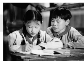
1999年/35ミリ/カラー/106分/中国 日本語・英語字幕付き 監督:シューイ・ゴン 出演:ツァオ・タン ウー・チンチン

60年代の中国。小学生サンサンの父親は校長先生であるため、立場上いつもサンサンに厳しかった。ある日ジーユエという女の子が転校してくる。ところがジーユエは校長の隠し子ではないかと噂が立つ。文化大革命以前の田舎の学校をノスタルジーを込めて描いた感動作。「草ぶきの学校」という題で劇場公開された。