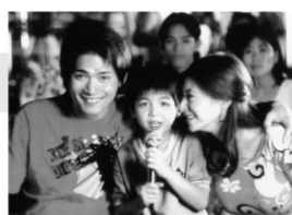
2005年/35ミリ/カラー/107分 フィリピン/日本語・英語字幕付き 監督:マー・メイリー 出演:ロビン・パティリア ルファ・マエ

タクシー運転手のジェスは、アメリカで働きたくて何度もビザを申請するが許可されない。ある日アメリカ人のテレビ番組制作者と知り合ったジェスは、彼の専属ドライバーになり、気に入ってもらおうと頑張る。フィリピン人の海外労働をチクリと皮肉った心温まるコメディ映画。