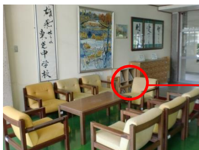
(応接セットの横に、新聞を保管しておく場所を設置)