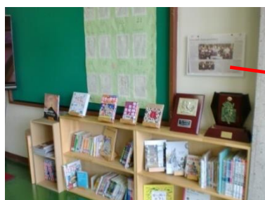
(掲示板には「おすすめの本の紹介文」を貼り、本の表紙を見せて配架)