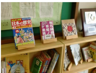
(書架の上には「日本の歴史」「椎名林檎の歌姫/素顔」などの表紙を見せて配架)