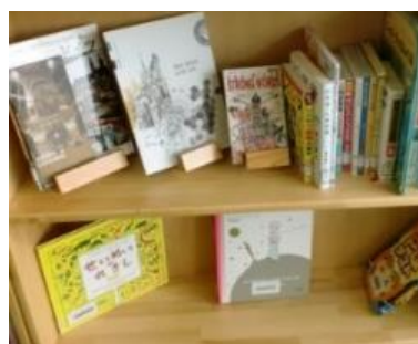
(ワンピースの「ストロング ワールド」写真と簡潔な文章で書かれた「ドイツ」などの表紙を見せて配架)