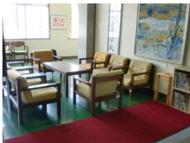
(玄関中央の応接セット)