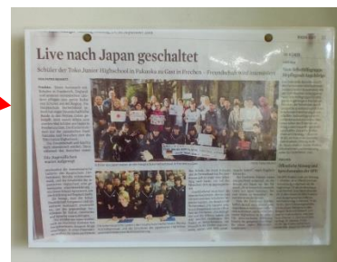
(ドイツの学校と姉妹校締結の様子を掲載した現地の新聞)