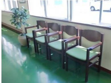
(廊下に並べられ読書がしやすい椅子)