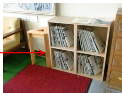
(授業などで活用するため保管されている新聞)