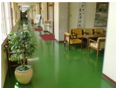
(1階の玄関、観葉植物の向こう側に椅子を並べてある)

廊下の色に合わせた椅子を置き、落ち着いた雰囲気を持たせています。生徒や職員、PTAが一つになって読書活動の推進に力を入れていることが、来校者にもよく分かります。