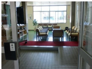
(玄関の中央に応接セット、向かって左に書架、奥の廊下に椅子を設置)

玄関を入ると、すぐ応接セットが設置してあり、そのまわりには本が並べてあります。廊下の椅子のそばには観葉植物を置き、ゆったりした気持ちで本に親しめるようにしています。