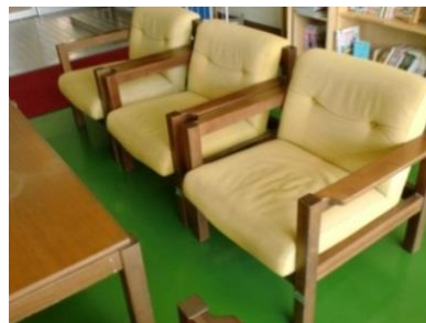
(肘置きがあり、座り心地がよさそうな椅子)