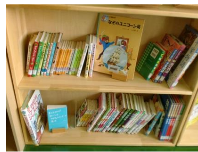
(読書の幅を広げるため、生徒が読みやすそうな「なぞのユニコーン号」と一緒に「平家物語」などの本を配架)