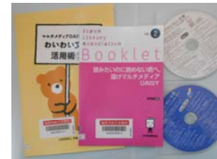
マルチメディアデージー

これまでいろいろな機会でご紹介してきたマルチメディアDAISY,大活字本,点字絵本,LLブック,リーディングトラックーなどがセットになって貸出できる準備が整いました。通称「たつちるっくセット」。ぜひ、ご利用ください。貸出の際に、学校に訪問してそれぞれの活用法お伝えすることもできます。まずは、学校図書館支援センターにお電話ください。おまちしています！